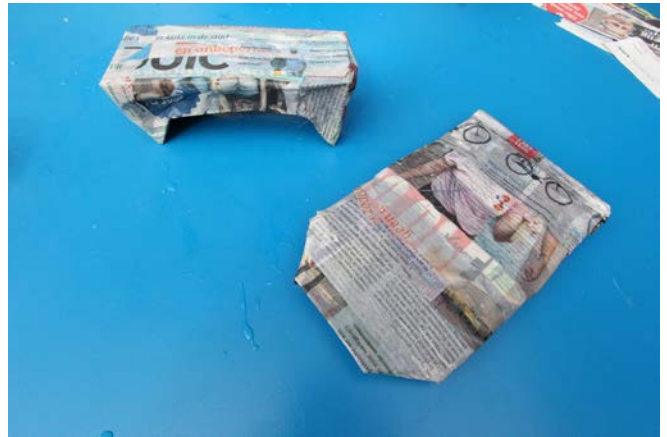
Beplak het pak met een laag kranten.