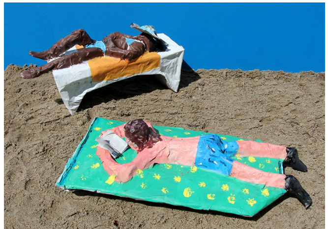
Beschilder het werkstuk na droging.