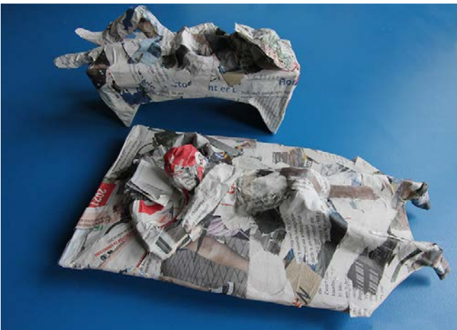
Maak van propfen papier-maché een mens.