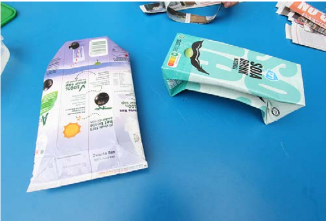
Vouw het pak in de juiste vorm.

Kies je voor de werkwijze papier-maché, gebruik dan een kartonnen pak als basis.